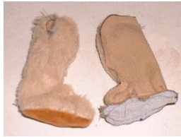
Couture des jambes