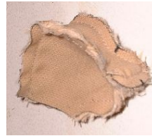
Insertion du soufflet