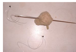
Pose des yeux