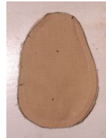
Couture du corps