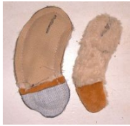
Couture des bras