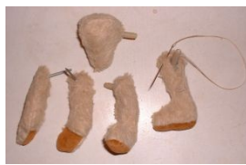
Fermeture des morceaux