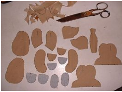
Tracé et coupe