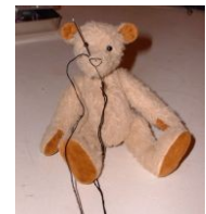
Broderie du nez