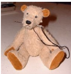
Broderie de la bouche