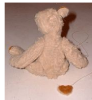
Pose des oreilles