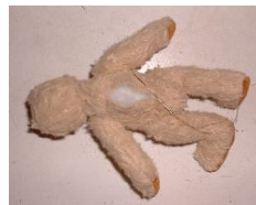
Fermeture du dos