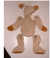
Le corps cousu